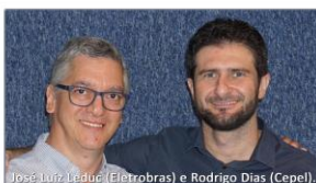
Candidatos da Chapa 2 ao Conselho Deliberativo

2 Representando de verdade os trabalhadores! CHAPA Transparência Independência Gestão participativa